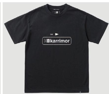
9000 / Black