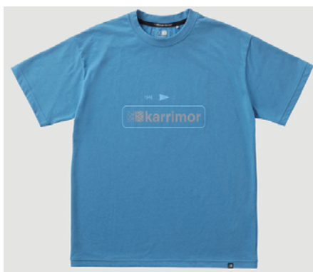
4530 / Atlantic Blue