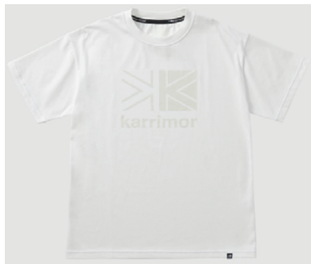
0130 / Optic White