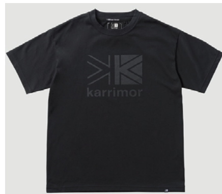
9000 / Black