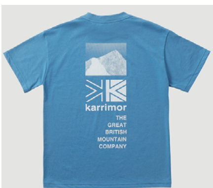
4530 / Atlantic Blue