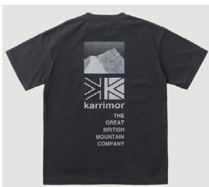
9000 / Black