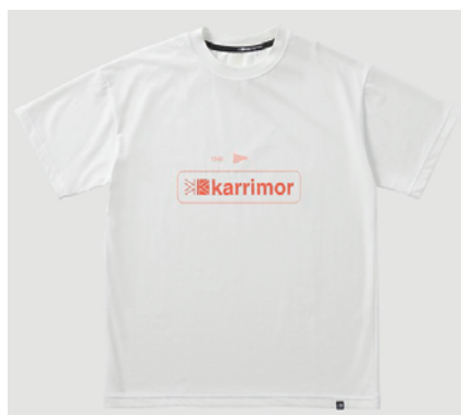
0130 / Optic White