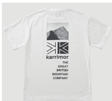
0130 / Optic White