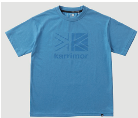
4530 / Atlantic Blue